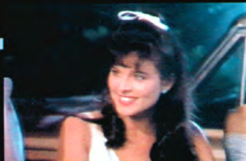
シンディー (声 津村まこと)