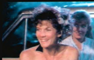
メーガン (声 岡村明美)