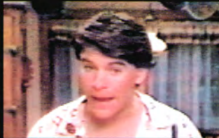
トニー (声 坪井智浩)

サラの兄。両親が出かけ、家の留守を守ることになるが、何か隠し事をしているらしい…。