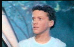
サラ (声 種田文子)

リサの弟だが、姉のリサよりしっかりとしている。今回の招待客中、ただ1人の少年だ。