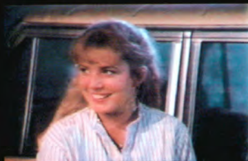
ケリー (声 井上喜久子)

サラに招かれた客を装いマーチン家に潜入している若いながら大変優秀なスカットの隊員。的確な判断を失わない冷静さは、隊長にも一目置かれている。