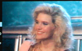
ダニー (声 石田彰)

ダニーの姉。自分ではしっかり者のお姉さんだと思っているが…すぐに革のバックをなくすおっちょこちょい。