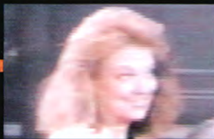
ジェフ (声 真殿光昭)

サラの兄。両親が出かけ、家の留守を守ることになるが、何か隠し事をしているらしい…。