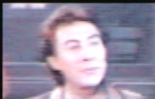
マーチン (声 納谷六郎)